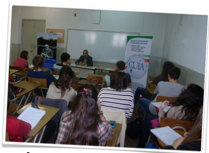
Presentación de la Cátedra Spinelli del CUIA