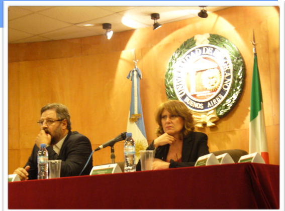
Info Day del CUIA alla Universidad de Belgrano

In occasione delle Giornate del CUIA in Argentina è stato firmato un accordo-quadro tra il CUIA e diverse istituzioni della Provincia di Salta, quali il Ministero de Educacion, Ciencia y Tecnologia de la provincia de Salta, la Universidad Nacional de Salta, la Universidad Catolica de Salta e la Fundación CAPACIT-AR del NOA). In tale occasione la stessa Universidad de Salta ha proposto di tenere un Info Day presso la sua sede per le Giornate CUIA in Argentina del 2013 nel quadro di un vivissimo interesse per le attività del Consorzio.