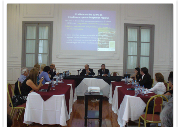
Info Day del CUIA alla Universidad de Rosario