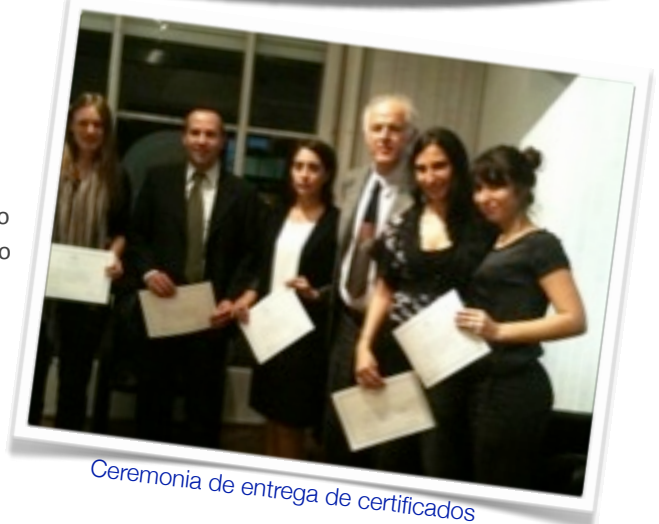
Ceremonia de entrega de certificados