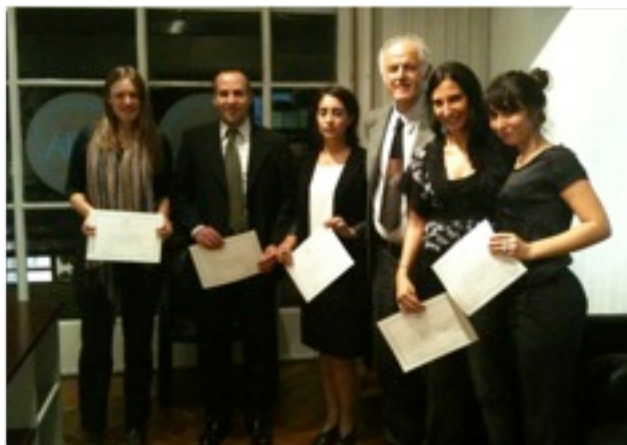
Consegna degli attestati di frequenza Corso di alta formazione EURAL, aprile 2012

In occasione delle Giornate del CUIA 2013 è prevista l'inaugurazione del Master online in studi europei ed integrazione regionale in America Latina, coordinato dalle Università di Roma La Sapienza, Camerino e Torino. E' prevista a breve la pubblicazione del bando. Per ulteriori info.: dsantarelli@cuia.net