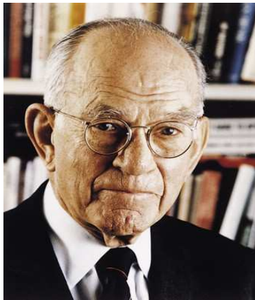
Senator J. William Fulbright 1905 - 1995

Incrementare la comprensione reciproca tra i cittadini degli Stati Uniti e i cittadini delle altre nazioni attraverso scambi culturali ovvero esperienze di studio, ricerca e insegnamento dei borsisti Fulbright.